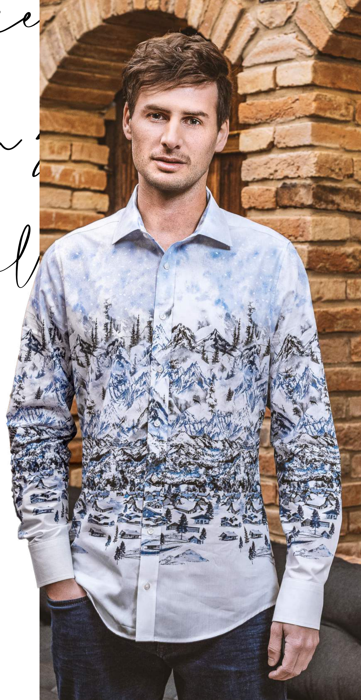
ARTIKELNUMMER: 46 / FT578 / 202 - 13